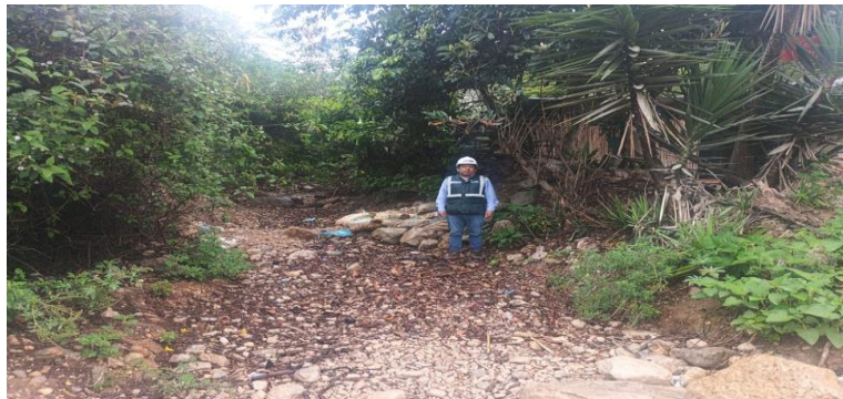
EN LAS VISTAS FOTOGRAFICAS SE OBSERVA EL TRAMO QUE REQUIERE DESCOLMATACION